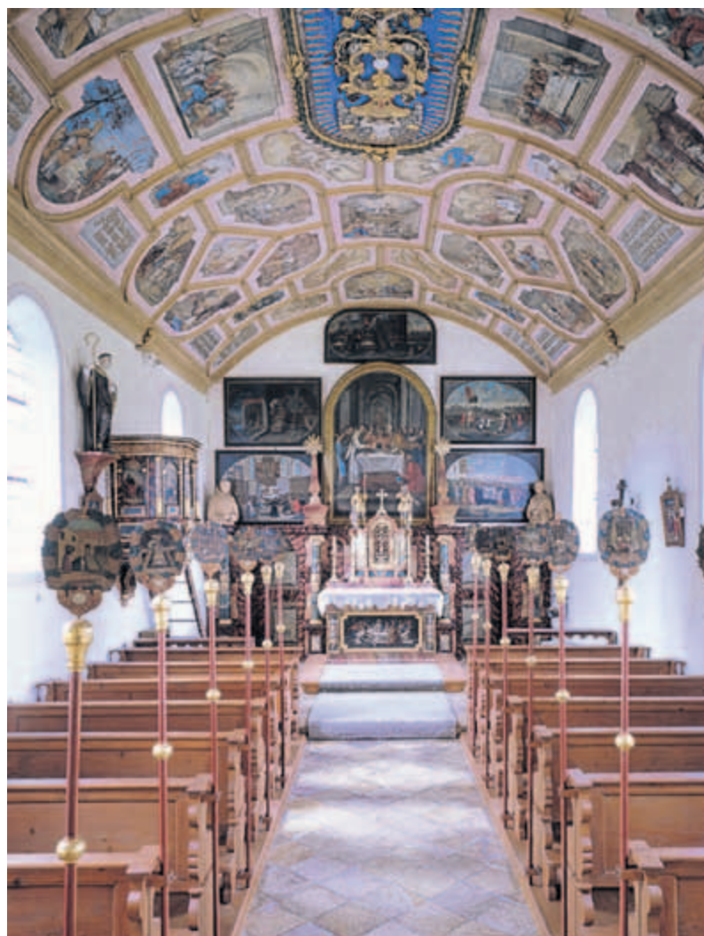
Das Innere der Riedkapelle gegen Osten

Wallfahrtskapelle „Unser Lieben Frau zu Eldern“ aus. Danach schweigen bereits die Quellen. Eine Ausbildung bei seinem Vater ist anzunehmen. In den Memminger Zunftakten taucht er nicht als selbständiger Meister auf, wo er seine Wanderjahre verbrachte, seine weiteren Kreise zog und letztlich verstarb, bleibt im Dunkeln. Jedenfalls