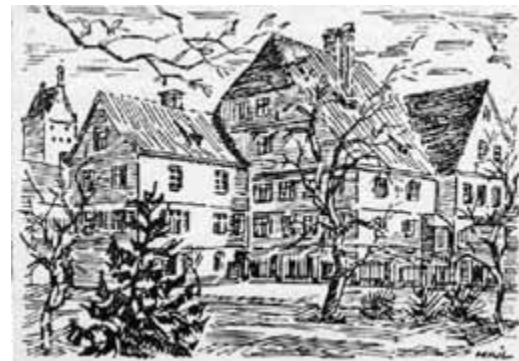
Hartliebsches Haus, heute Grimmelhäuser, gezeichnet von Fritz Hail in den 30er Jahren des 20. Jahrhunderts

Schon 1525 wurde er in den Rat der Reichsstadt gewählt und mehrere Jahre Stadtrichter und Kapellenpfleger. Leicht hatte er es