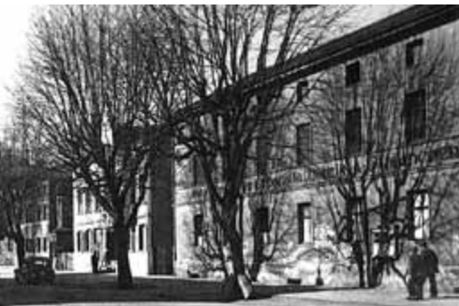
Malzfabrik August Forster an der Bahnhofstraße in den 20er Jahren des 20. Jahrhunderts

Auf der gegenüberliegenden Straßenseite im nördlich an die Bahnstation angrenzenden Areal ließ die Königlich-bayerische Postdirektion einen kleinen Bach im Graben zwischen Altstadt und Bahngleisen verrohren. Darüber erstand 1899/1901 ein Palais im Stil italienischer Renaissance für die königlich-bayerische Post.