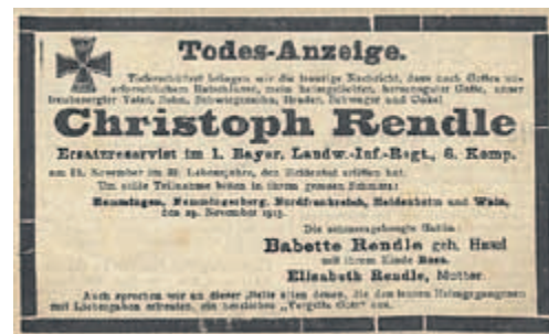
Todesanzeige in der Memminger Zeitung November 1915