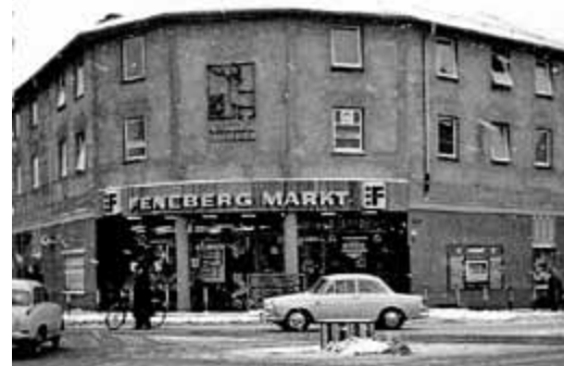
Feneberg-Markt im Eckhaus an der Kreuzung 1964

Da der Einkaufsmarkt unmittelbar an Memmingens damals verkehrsreichster Kreuzung lag, war im Stadtrat in den Monaten zuvor der Einbau von Arkaden für die Fußgänger diskutiert worden, um die Straße zu verbreitern bzw. mit einer getrennten Rechtsabbiegespur zur Augsburger Straße zu versehen, damit der Nord-Süd-Verkehr bei geschlossener Schranke unbehindert