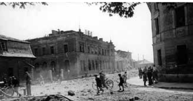
Malzfabrik und Post nach den Fliegerangriffen im Juli 1944

Beide Gebäude – Postamt und Malzfabrik – überstanden im Juli 1944 und April 1945 die Fliegerangriffe auf Memmingen, den Bahnhof und den nahegelegenen Fliegerhorst nahezu unbeschädigt. 3