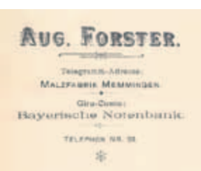
Briefkopf der Fa. August Forster 1903 (Stadtarchiv Memmingen)

Bis zur Industrialisierung wurde Malz in den (zahlreichen) Brauereien hergestellt. Dies änderte sich im Laufe des 19. Jahrhunderts grundlegend. In Memmingen eröffnete am 15. Oktober 1871 unmittelbar vor der ehemaligen reichsstädtischen Stadtmauer August Forster eine Malzfabrik (Kalchstraße 38) – gleich neben einem alten Färberhaus aus dem 16./17. Jahrhundert, das einst der Torwart und Torzollpächter beim Kalchtor bewohnt hatte.