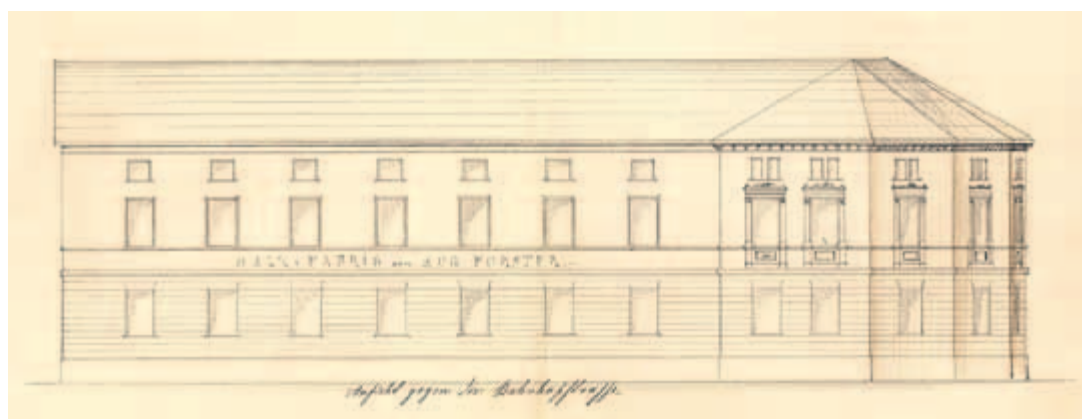
Fassadenentwurf 1871